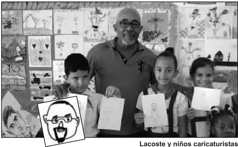
Lacoste y niños caricaturistas.