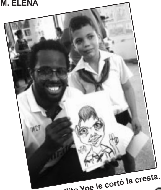
A este gallito Yoe le cortó la cresta.